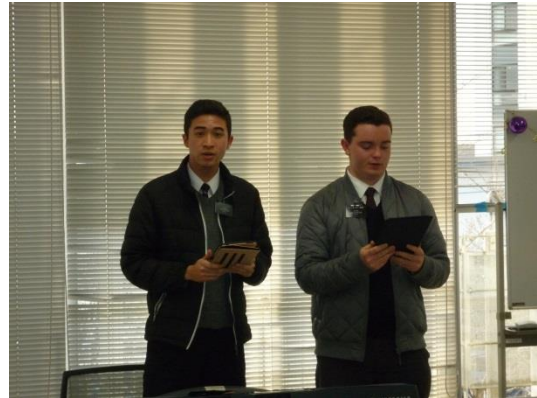
19 歳若者のハーモニーに心洗われました。