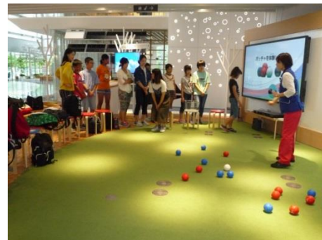
二日目はロンドンパラリンピック走り幅

今年度のサマースクールは初日パナソニックセンター東京に行きました。パラリンピックの種目の一つ「ボッチャ」を楽しく学びました。「ボッチャ」は重度の障害の方でも出来るように考案されたカーリングに似た競技です。