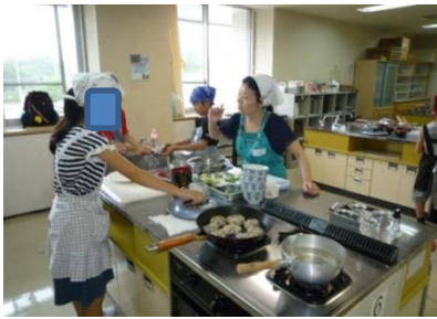
対馬さん多岐にわたりご協力ありがとうございます。 ございます。