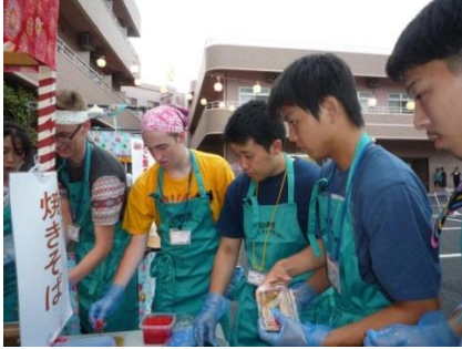
焼きそば 流れ作業でパック詰め