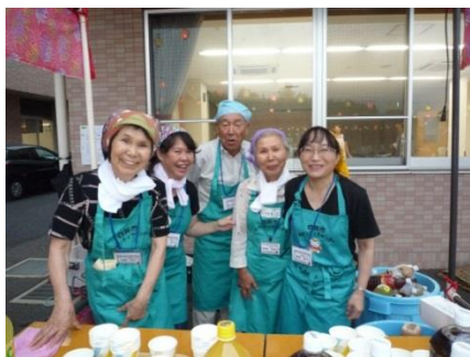
毎年皆様ありがとうございます。