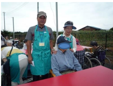
二宮様ご夫婦 夫婦そろって付添ボランティア ありがとうございます。