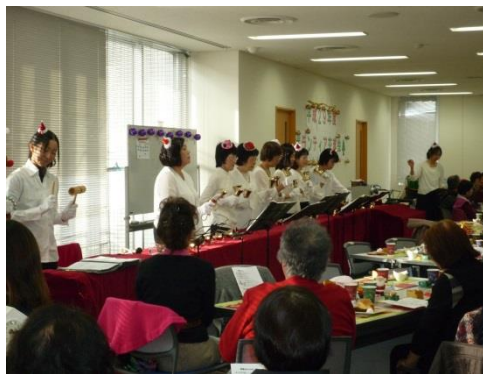
ハンドベル演奏 16 名の皆様の素敵な演奏でした。