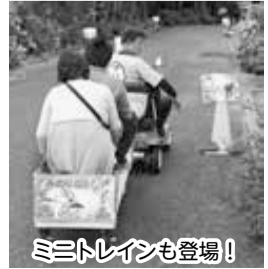
ミニトレインも登場!