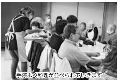
手際よく料理が並べられています

10月のシニア食堂へ行ってきました。11時半開始にも関わらず、時間前から続々と参加者が集まっています。思い思いの席に座り、早速おしゃべりが始まります。ひと月に一回のシニア食堂を楽しみにされているようです。