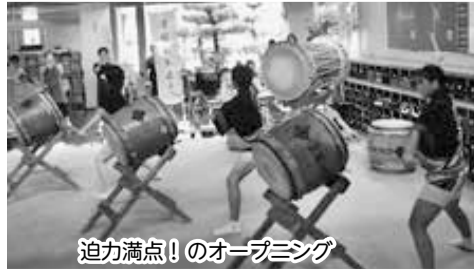
迫力満点!のオープニング

チャリティー募金 ご協力のお礼 白井市 陶芸連絡協議会様 5,000円 ご寄付をいただき ありがとうございました。