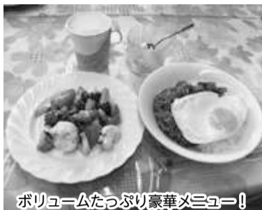
ボリュームたっぷり豪華メニュー!

今回のメニューは「キーマカレー・パッチョトマドレサラダ・フルーツカクテル」でした。なんと記者にもご馳走してくださいました。見た目も香りもよく、ボリュームたっぷり、美味しく完食しました。メニューは季節に合わせて毎回変えているそうです。