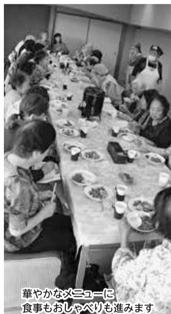
華やかなメニューに食事もおしゃべりも進みます