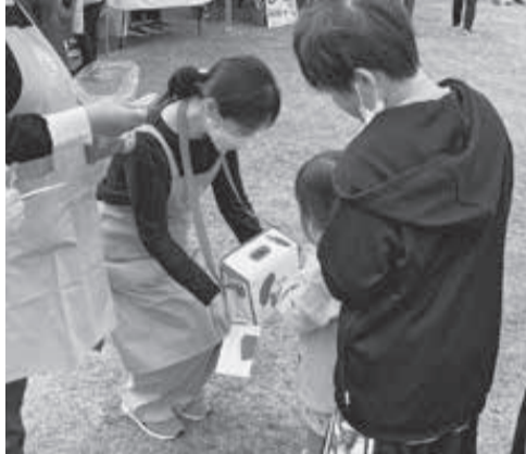
かわいい善意をありがとう