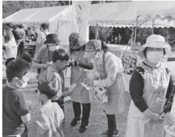
ふるさとまつり会場での募金活動の様子