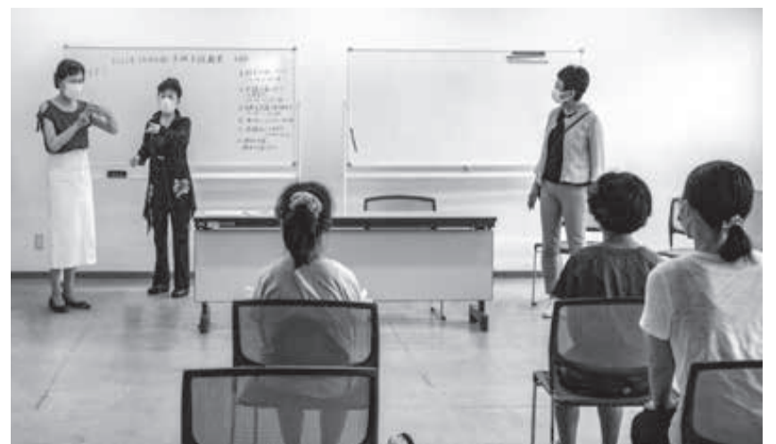
子ども手話教室の様子

今後もこのような活動を通し、手話というコミュニケーションツールを広めていきたいと思っています。