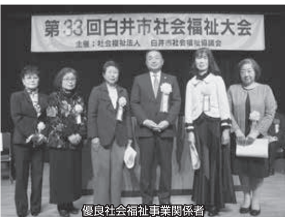
優良社会福祉事業関係者