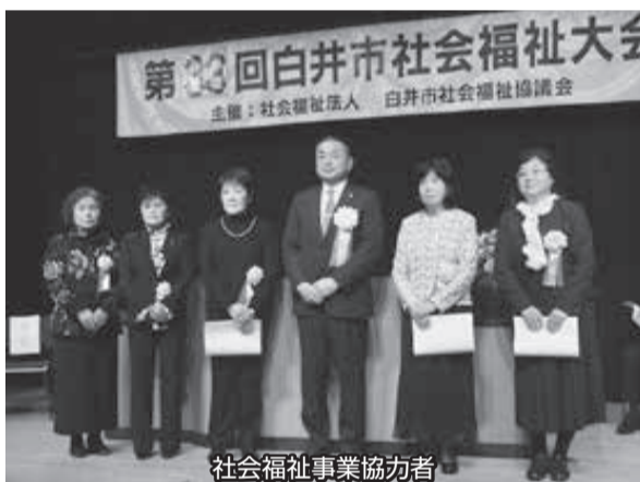
社会福祉事業協力者

最後のアトラクションでは「ユーカリアンサンブル」の皆さんによる楽器演奏が披露され、大会は和やかな雰囲気の中、盛会裏に終了しました。令和最初の社会福祉大会でしたが、今後へとつながる意義ある大会となりました。