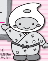
ふくまる 白井市社会福祉協議会 イメージキャラクター